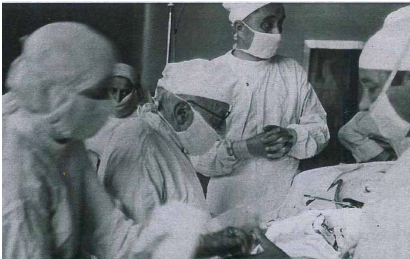
Rycina 3. Operuje profesor Tadeusz Butkiewicz

Powiększono również pododdział ortopedyczny do 80 łóżek, dzięki temu mógł przyjąć większą liczbę pacjentów dorosłych i dzieci. Zmieniono również tryb dyżurowy – lekarze przestali pełnić dyżury lekarzy ogólnych szpitala, obowiązki te pełnili już tylko na oddziale chirurgicznym [6-9].