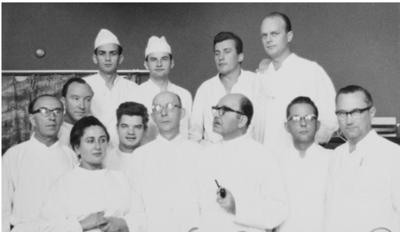
Rycina 4. Zespół Kliniki

istnienia oddziałów opublikowano 67 prac, z czego 54 od dnia powołania 2. CSK WAM [9] (Ryc. 4).